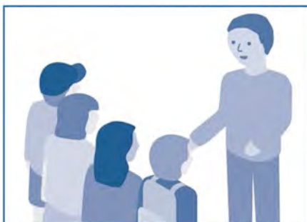
Bibliotekeren fortæller om "Bibliobitternes Ø".