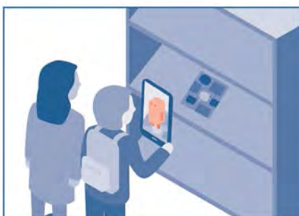
Eleverne finder bibliobitten.