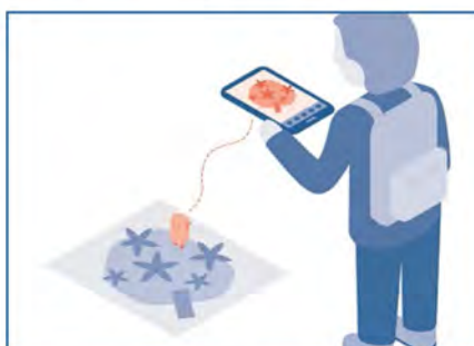
De tager den med tilbage til øen.