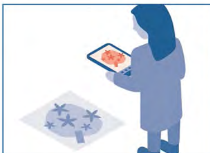
Eleverne kigger på øen gennem tablets.