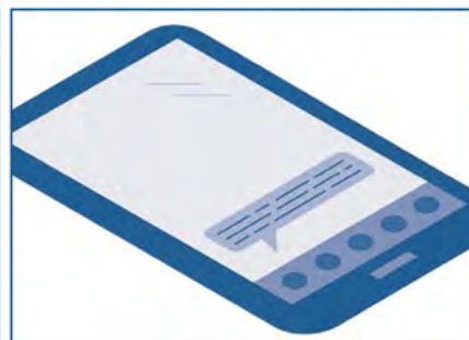
Eleverne får et hint til en bibliobit.