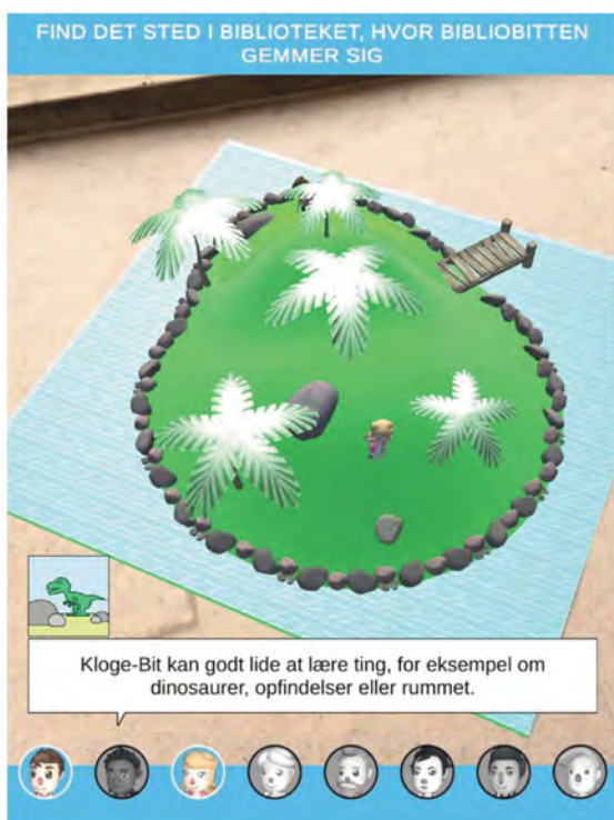
Screenshot fra en typisk "gennemspilning" af "Bibliobitternes Ø", efter to bibliobitter er fundet.

10 mulige koncepter blev identificeret i processtarten, og man udviklede på de tre af dem. Herefter blev et af de tre, Bibliobitternes Ø , valgt ud som det oplagte at gå videre med. De syv, som ikke nåede videre, gik på: Fobier, Visualisering af DK5-systemet, Oversættelse (for brugere, der ikke taler dansk), En virtuel udgave af en romankarakters verden, Spejlbilleder – om at se sig selv i andre universer, Rejse-