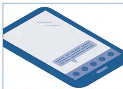
Eleverne skal nu finde den næste bibliobit og fortsætter, til de har fundet dem alle.

oplevelser – noget tilsvarende – og Way-finding – om at finde rundt i biblioteket. Alle koncepter med både fordele og ulemper og flere af dem meget omfattende at skabe relevante AR-apps til.